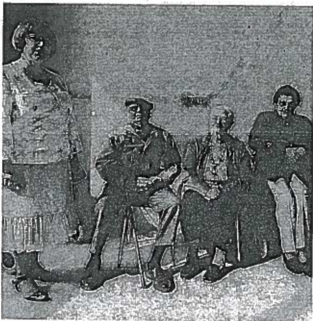
Trois résidents ont découvert les nouveaux locaux.

Les candidatures sont recueillies dès maintenant par la résidence. Le dossier d'inscription est à retirer au 49 rue Jean-Baptiste Legeay à Geneston. Renseignements au 02 40 26 70 33.