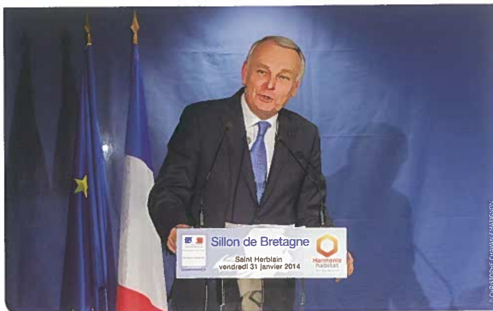
CHRISTOPHE CHAVAN / MATIGNON